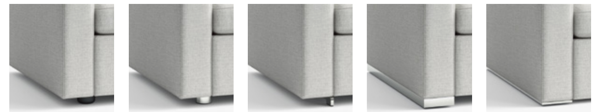
Gleiter Black glide Zylinderfuß kurz Cylindrical short foot Schmalfuß kurz Short L-leg Rahmenfuß Profile foot Sockelplatte* Base trim*

Fußvarianten für Korpus bodennah Foot variants for divan base elements