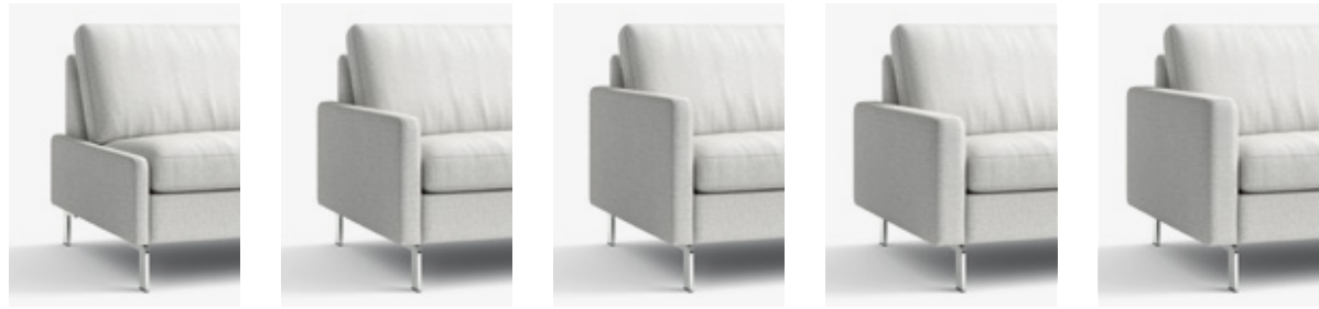
B 4 cm, H 42 cm W 4 cm, H 42 cm B 6,5 cm, H 54 cm W 6,5 cm, H 54 cm B 6,5 cm, H 60 cm W 6,5 cm, H 60 cm B 12 cm, H 54 cm W 12 cm, H 54 cm B 12 cm, H 60 cm W 12 cm, H 60 cm

Armlehnenformen für Korpus bodenfrei Armrest styles for open base elements