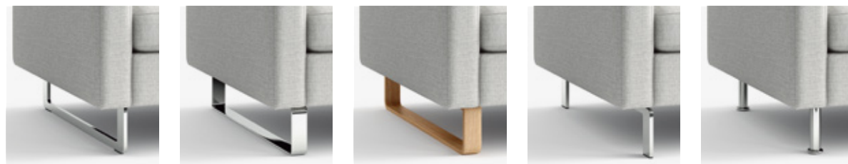
Schmalkufe Slim skid Metallkufe Metal skid Holzkuße Pre-formed wooden skid Schmalfuß L-leg Tellerfuß Disc foot

Fußvarianten für Korpus bodenfrei Foot variants for open base elements