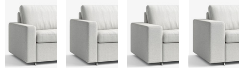
B 16 cm, H 54 cm W 16 cm, H 54 cm B 16 cm, H 60 cm W 16 cm, H 60 cm B 24 cm, H 54 cm W 24 cm, H 54 cm B 24 cm, H 60 cm W 24 cm, H 60 cm