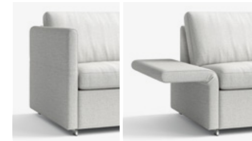
B 7/32 cm, H 72 cm W 7/32 cm, H 72 cm