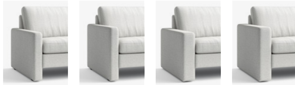
B 12 cm, H 54 cm W 12 cm, H 54 cm B 12 cm, H 60 cm W 12 cm, H 60 cm B 16 cm, H 54 cm W 16 cm, H 54 cm B 16 cm, H 60 cm W 16 cm, H 60 cm