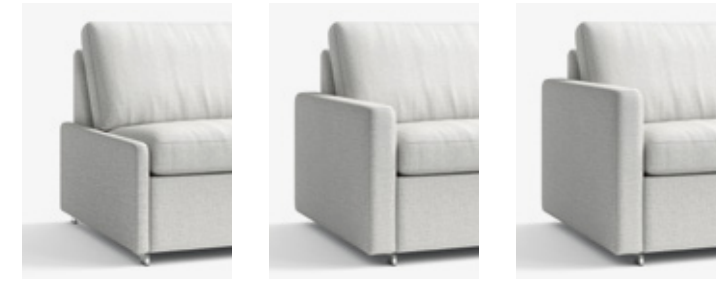
B 4 cm, H 42 cm W 4 cm, H 42 cm B 12 cm, H 54 cm W 12 cm, H 54 cm B 12 cm, H 60 cm W 12 cm, H 60 cm

Armlehnenformen für Korpus bodennah Armrest styles for divan base elements