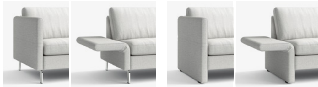
B 7/32 cm, H 72 cm W 7/32 cm, H 72 cm B 7/32 cm, H 72 cm W 7/32 cm, H 72 cm