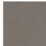
684 grigio / grigio