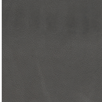
681 graphit / graphit