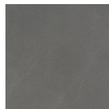
682 elefantengrau / elephant grey