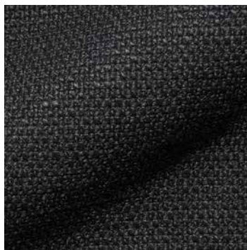
5010 anthrazit / anthracite