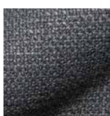
5016 mittelgrau / middle grey