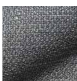
5015 hellgrau / light grey