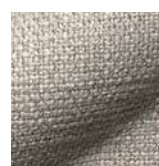
5021 sand / sand