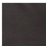
455 espresso / espresso