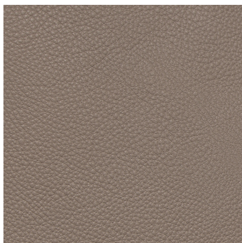
453 quarz / quartz