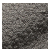
14002 hellgrau / light grey