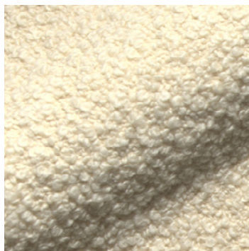
14001 wollweiß / wool white