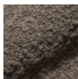
14003 taupe / taupe